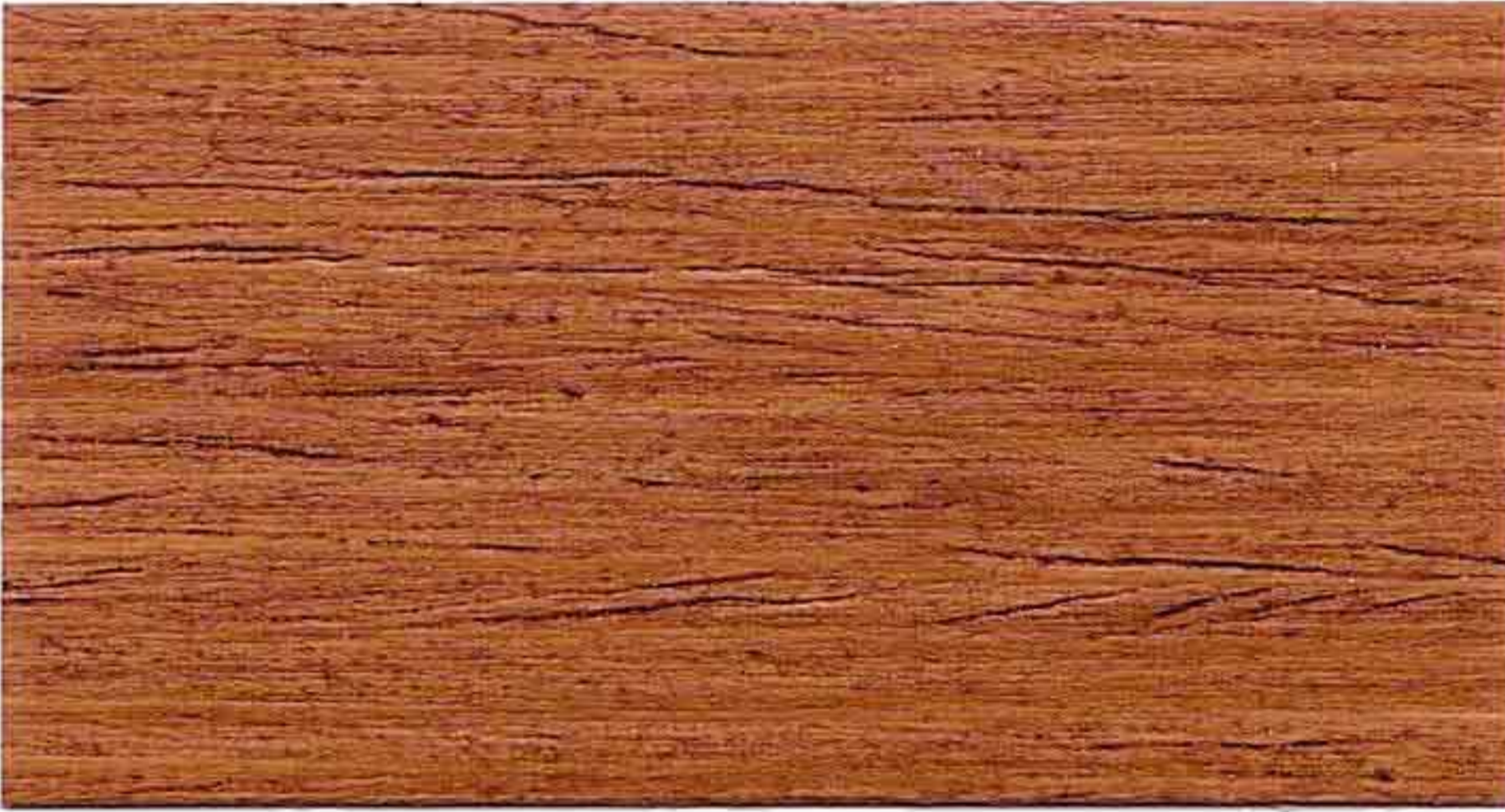
ROVERE 2° MANO