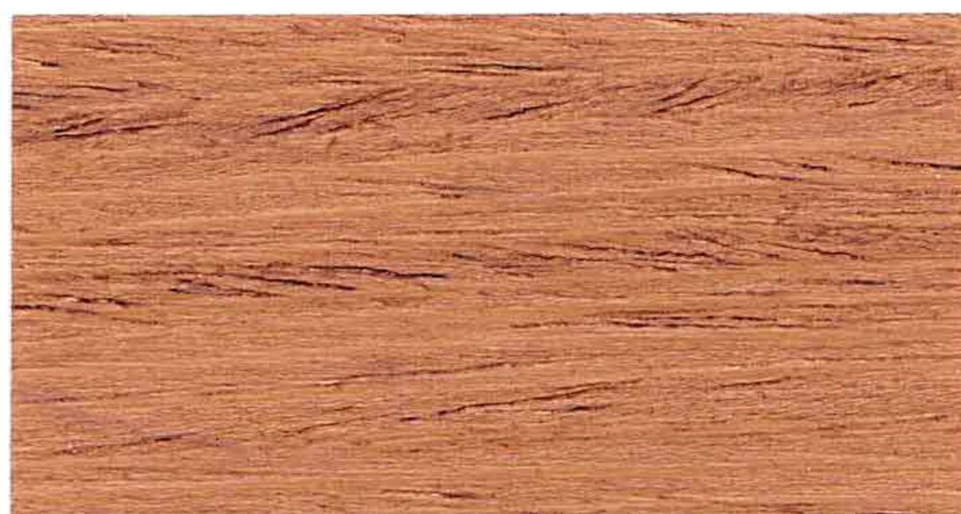
ROVERE 1° MANO