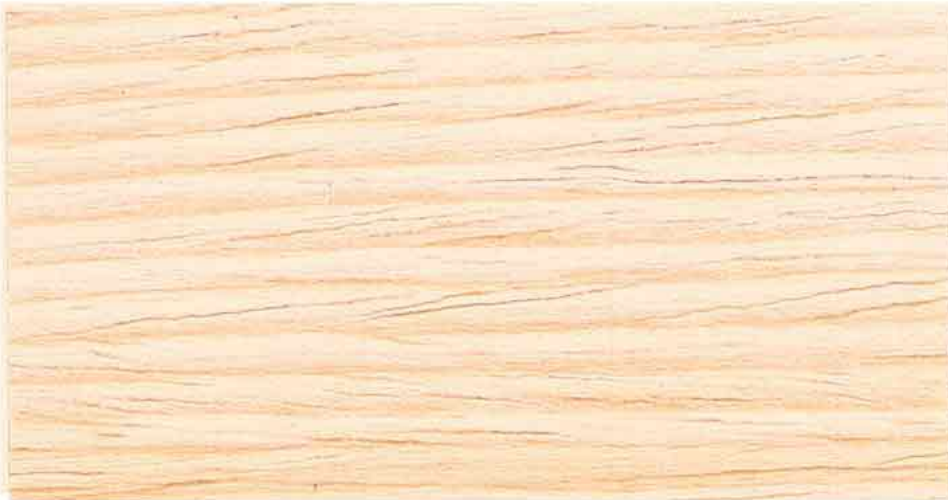
INCOLORE 1° MANO