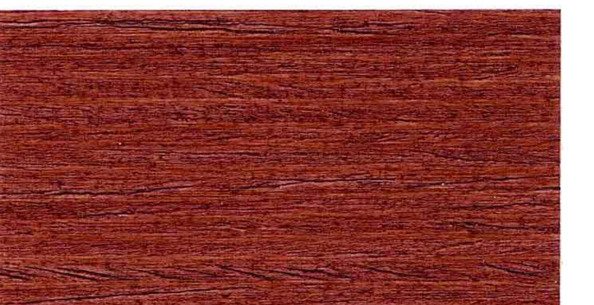
MOGANO 2° MANO

Non disponibili con FINITURA CERATA AD ACQUA - Не имеются в наличии в версии на водной основе FINITURA CERATA AD ACQUA - Not available with FINITURA CERATA AD ACQUA - Non disponibles en FINITURA CERATA AD ACQUA - Nicht verfügbar mit FINITURA CERATA AD ACQUA - No disponibles con FINITURA CERATA AD ACQUA - Nu sunt disponibile pentru FINITURA CERATA AD ACQUA - Δεν διατίθενται με FINITURA CERATA AD ACQUA