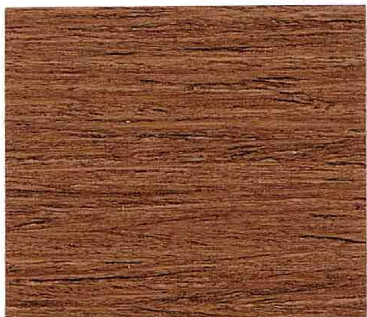
NOCE CHIARO 1° MANO