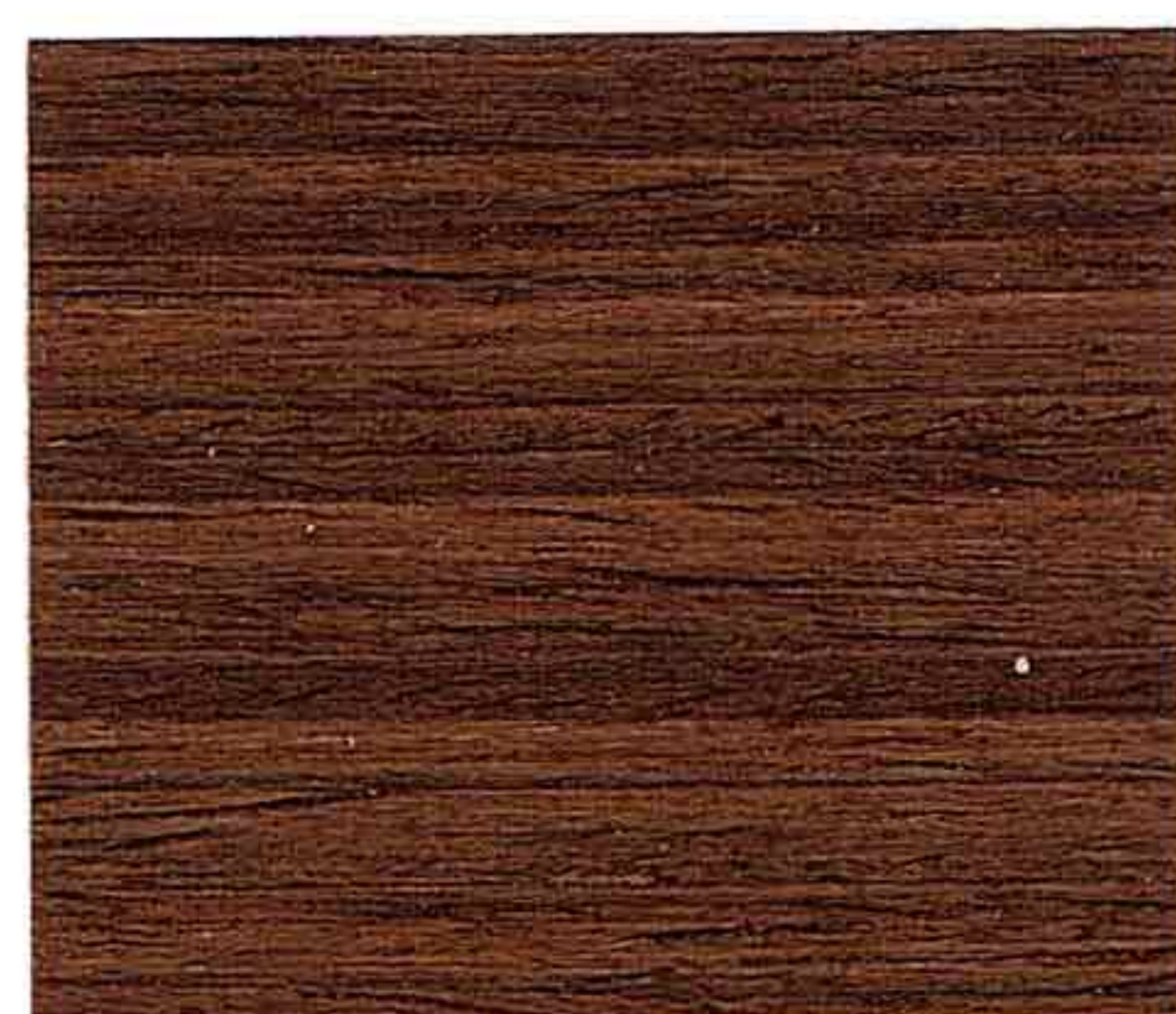
NOCE CHIARO 1° MANO