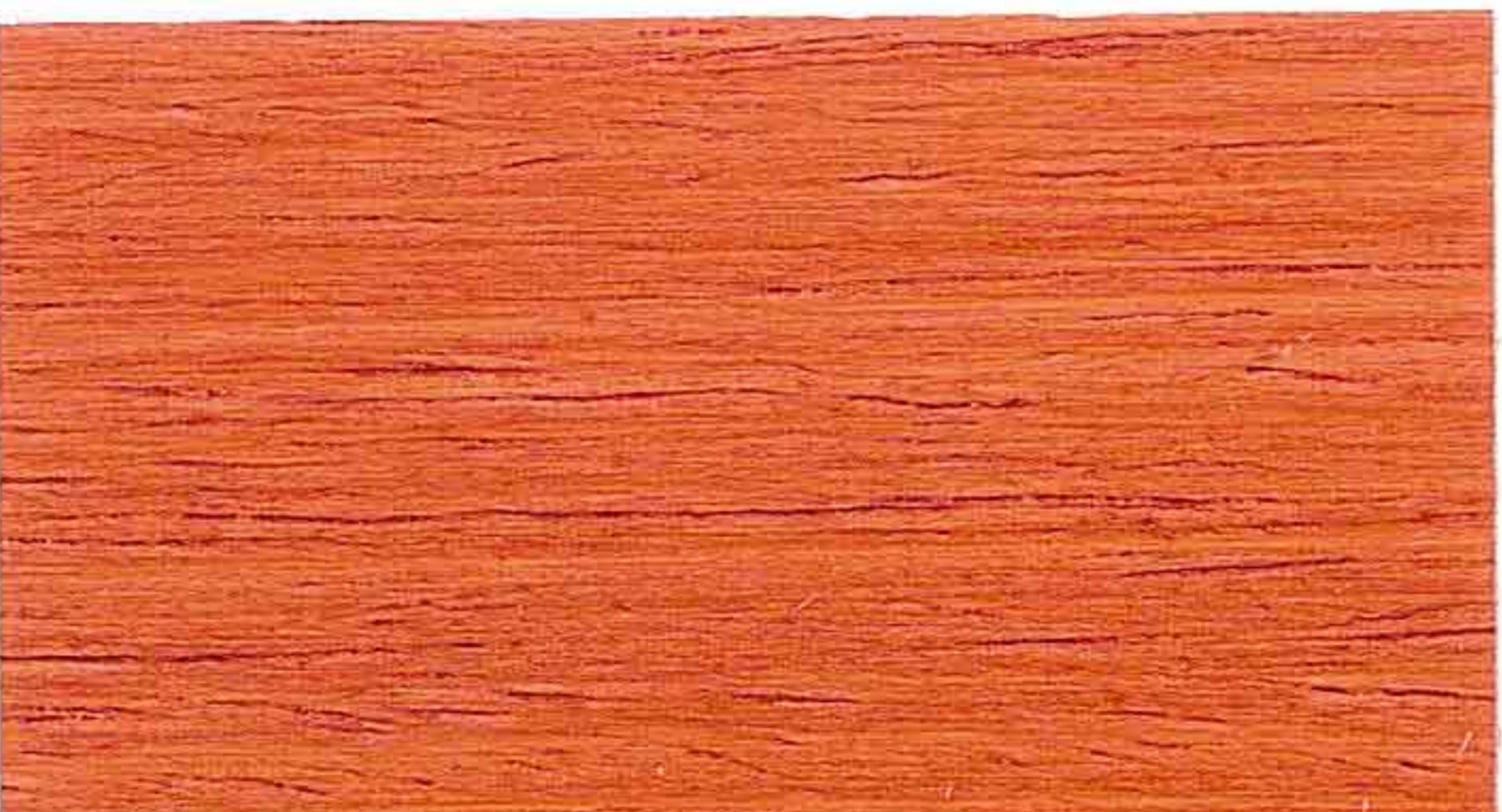
RED WOOD 2° MANO