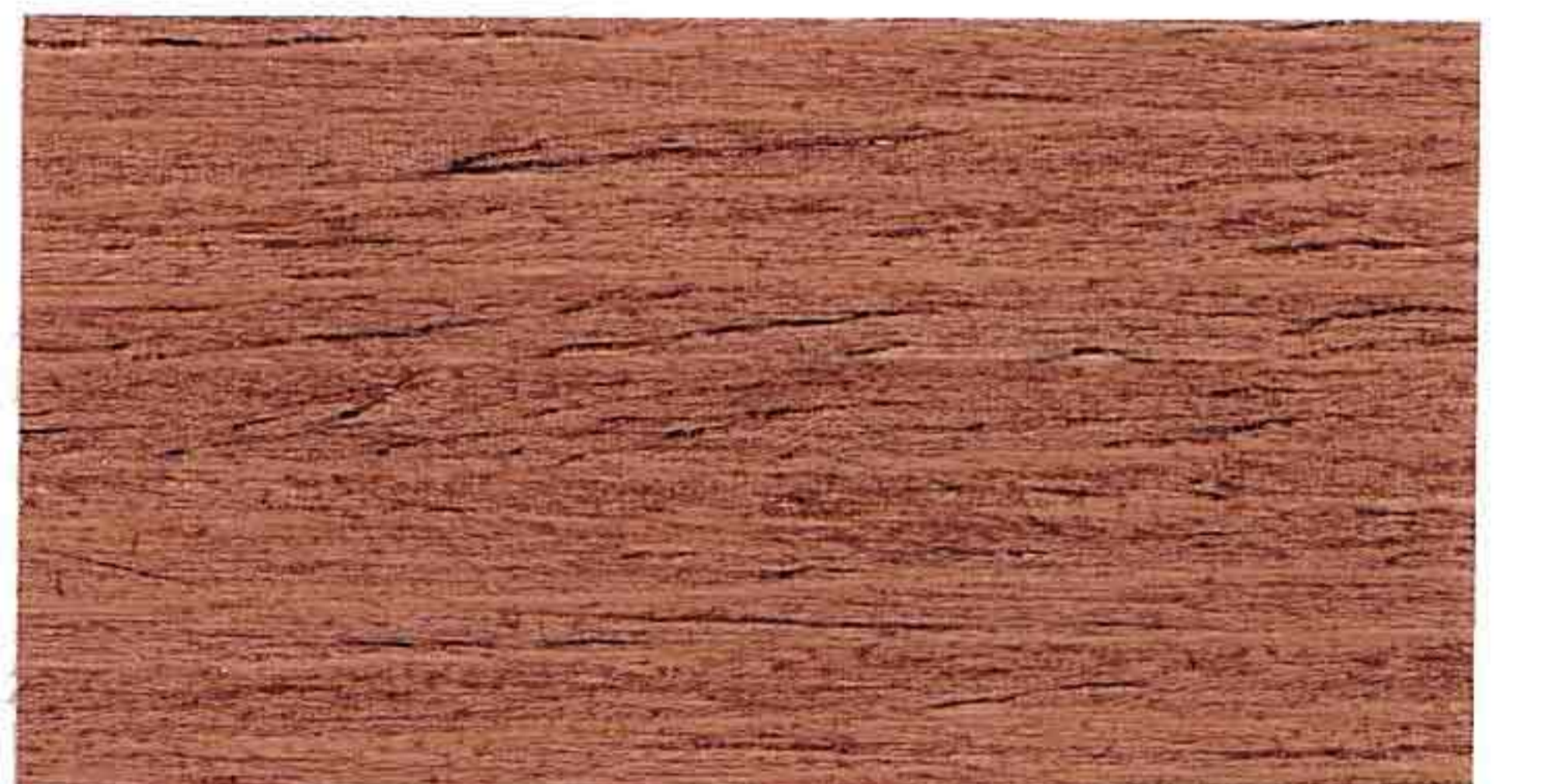
NOCE CHIARO 1° MANO