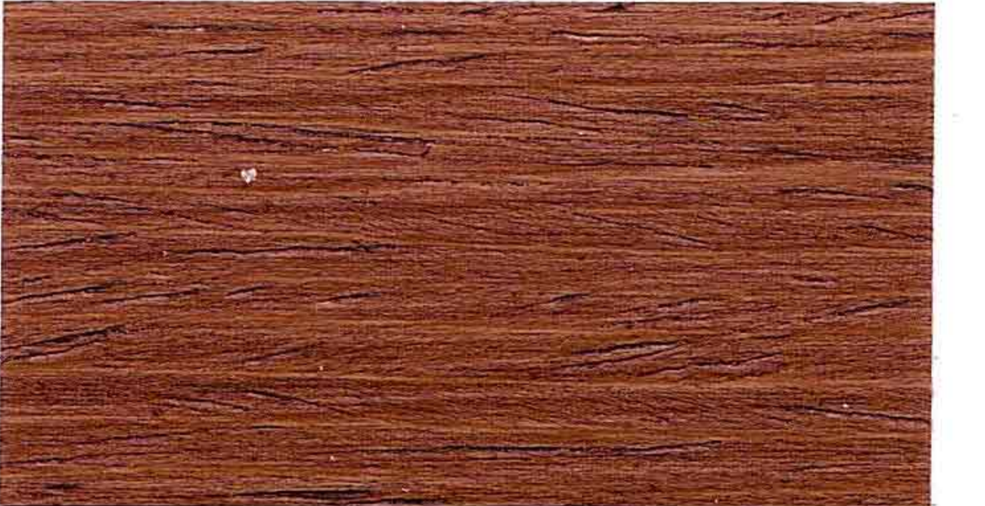
NOCE CHIARO 2° MANO