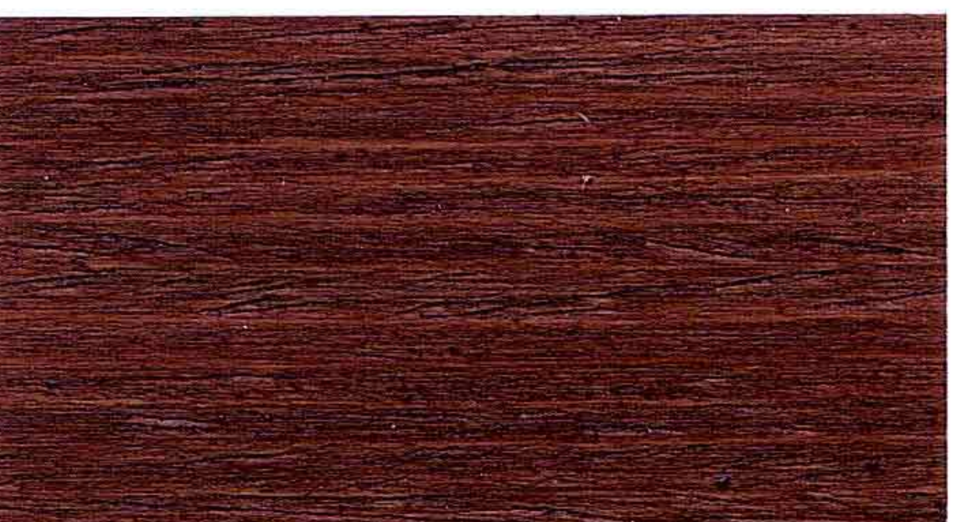
NOCE SCURO 2° MANO