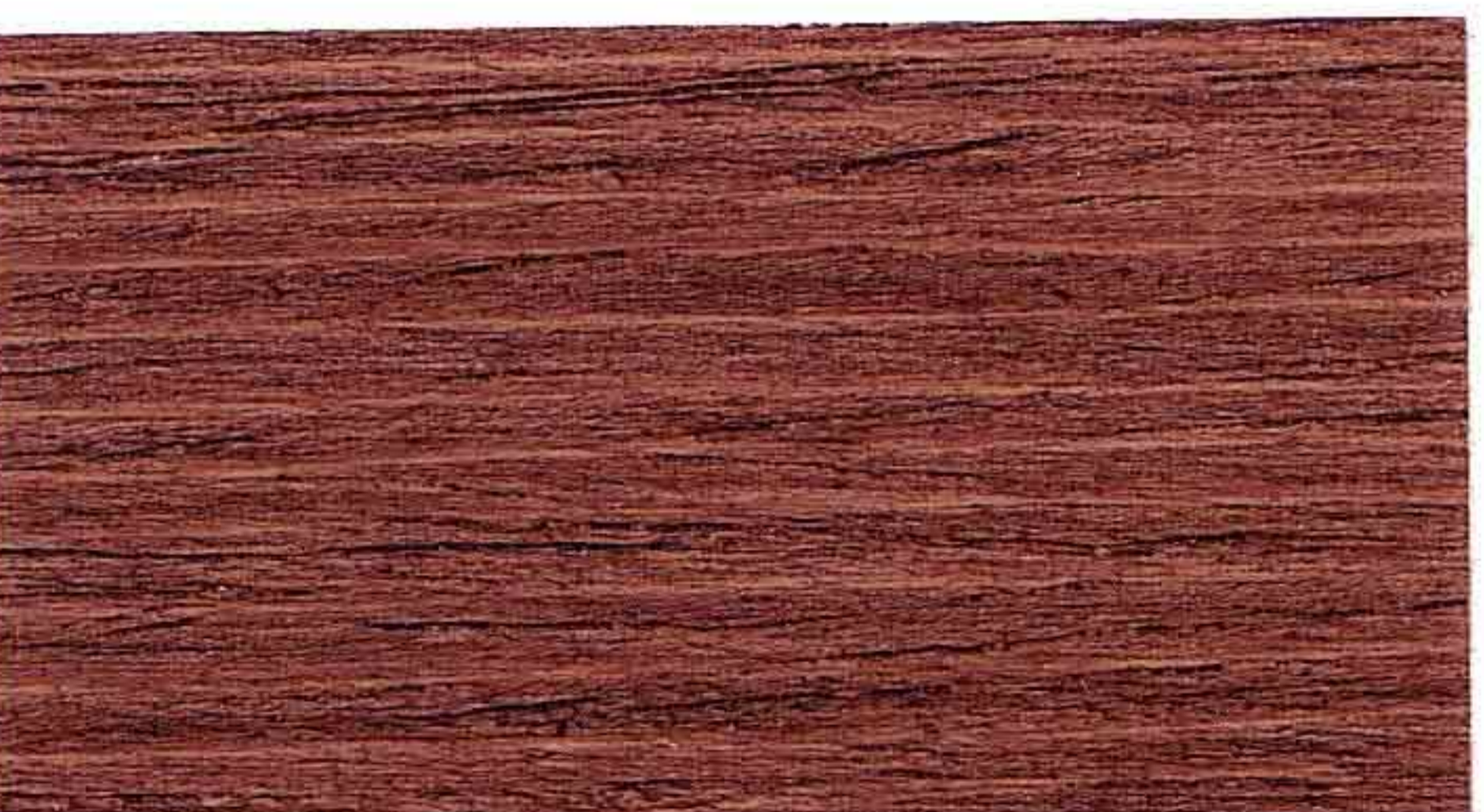
NOCE SCURO 1° MANO