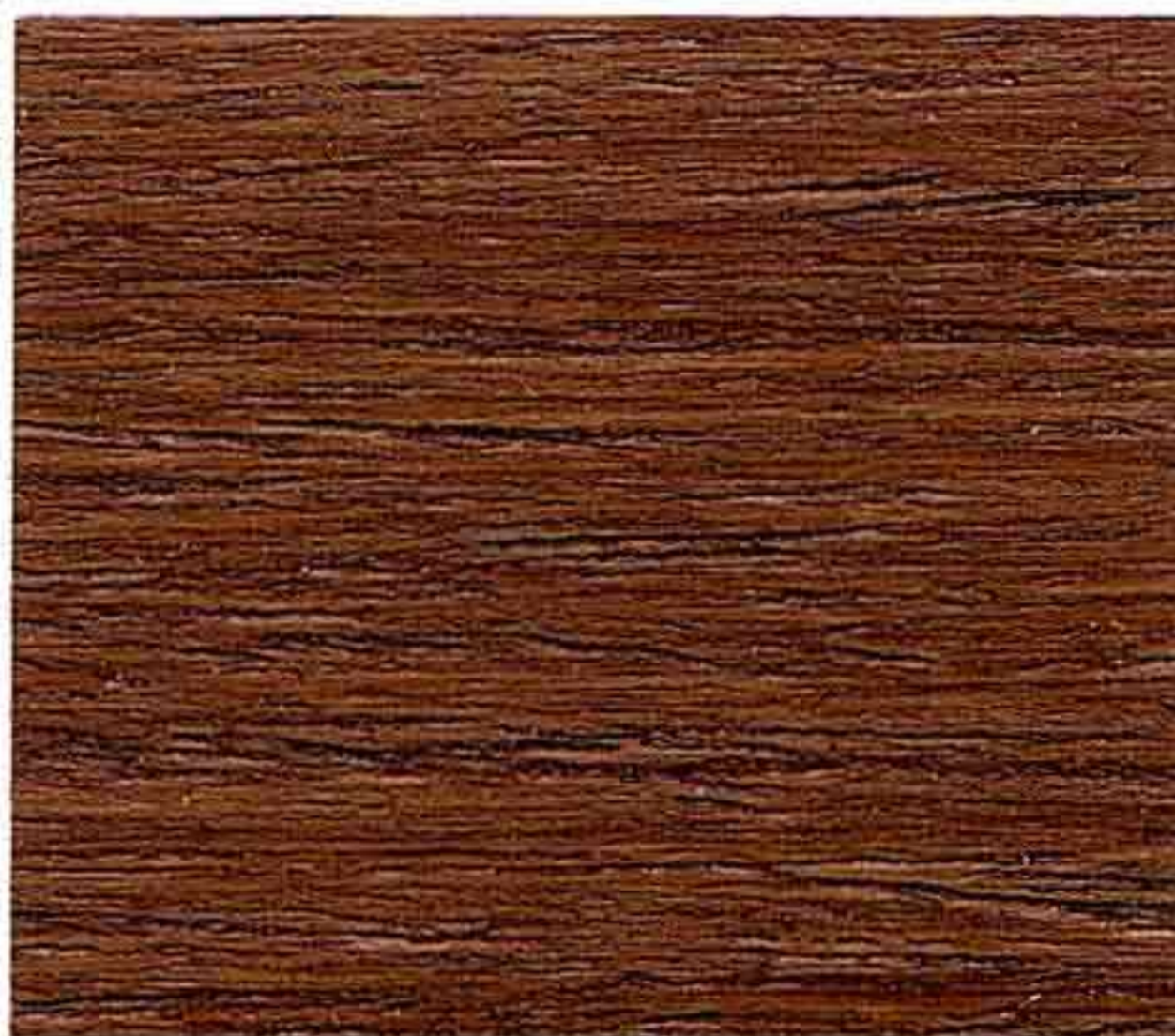
NOCE CHIARO 2° MANO