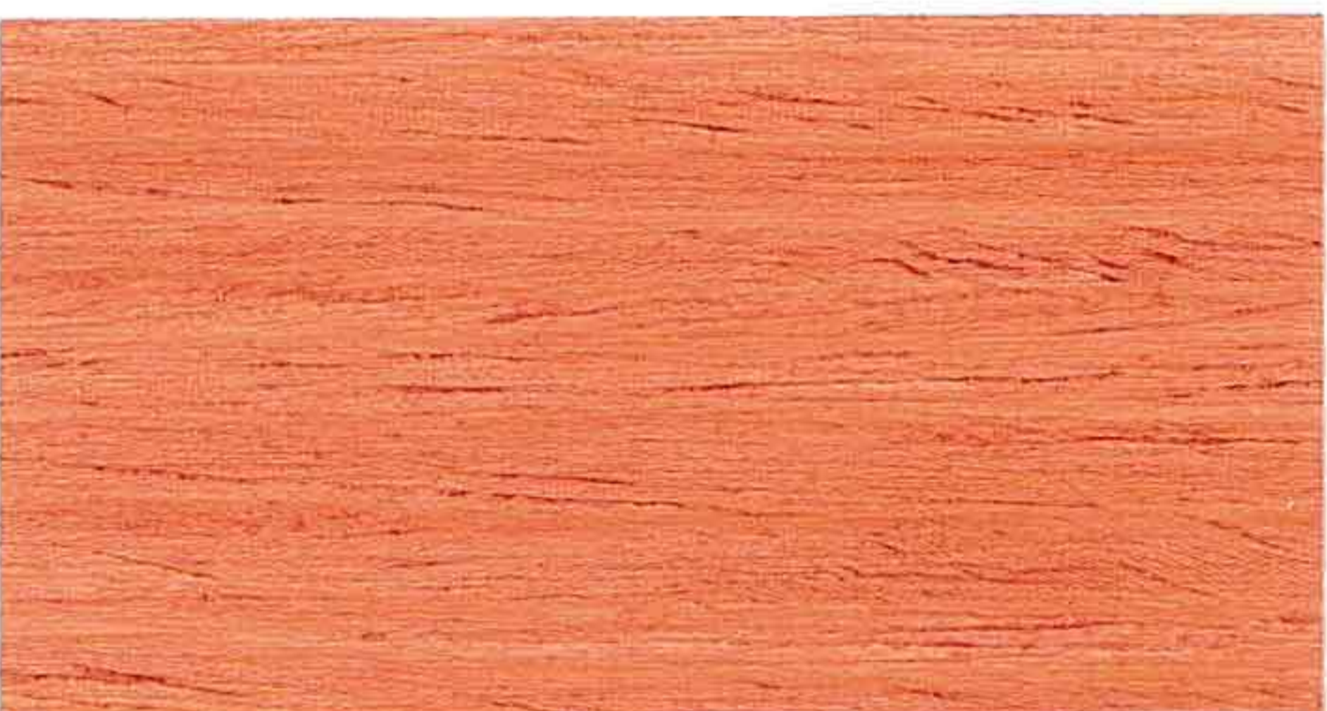
RED WOOD 1° MANO