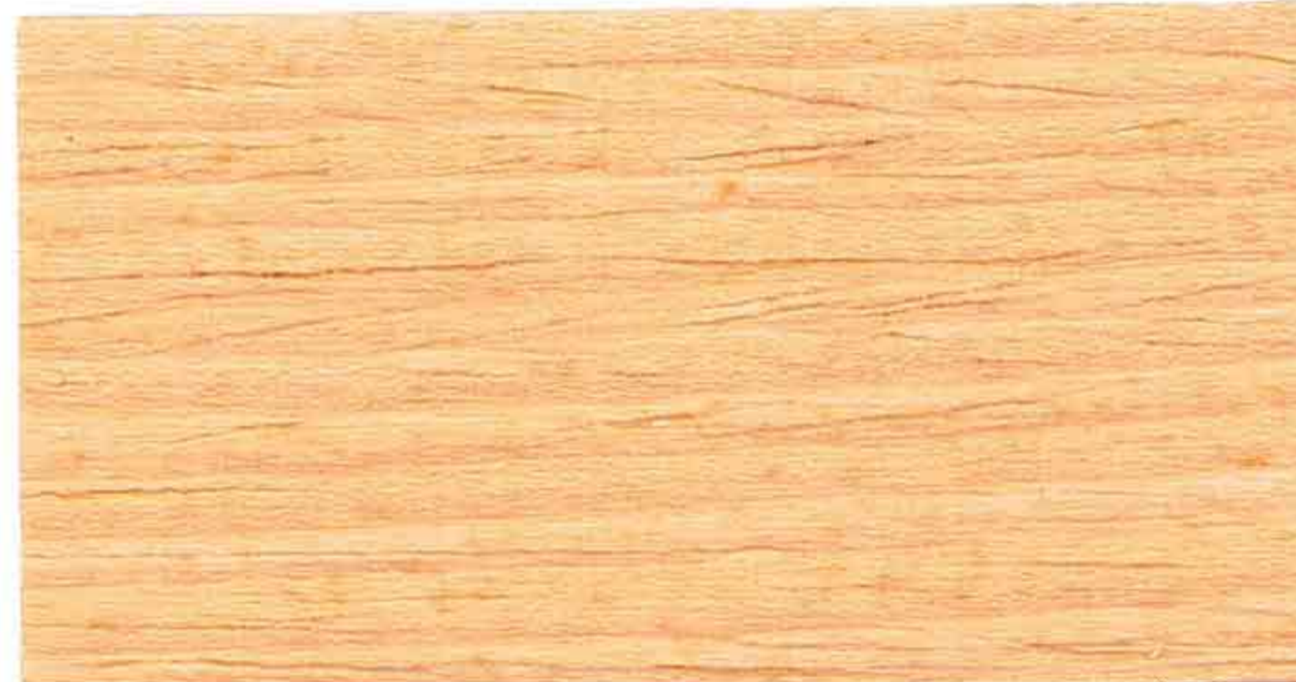
PINO 1° MANO