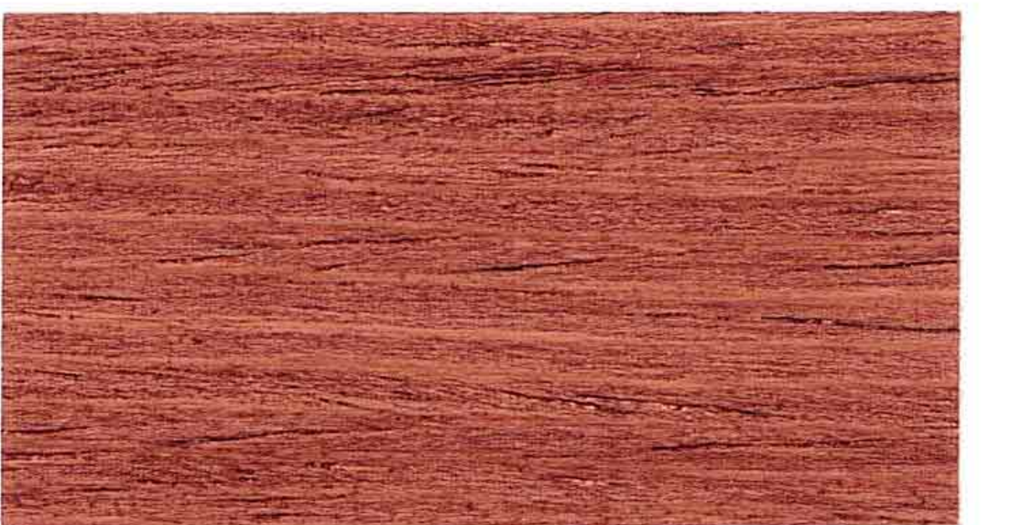
MOGANO 1° MANO