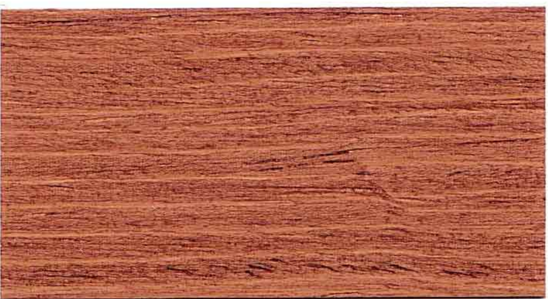
CASTAGNO 1° MANO