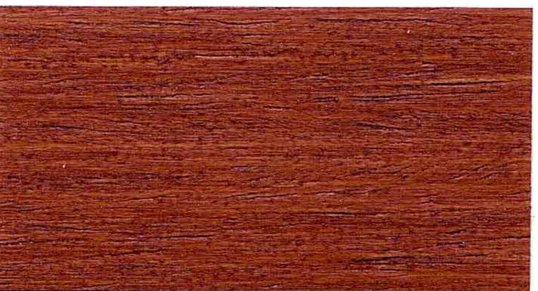
CASTAGNO 2° MANO