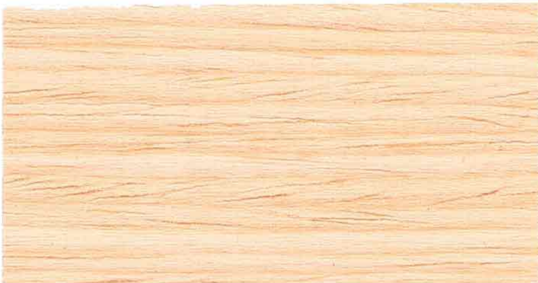
INCOLORE 2° MANO