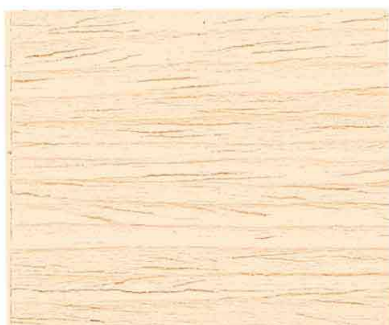
LEGNO NATURALE CHIARO

ПРОДУКТИВНОСТЬ НА РАЗЛИЧНЫХ ТИПАХ ДЕРЕВА - YIELD ON DIFFERENT TYPES OF WOOD - RENDEMENTS DIFFERENTS TYPES DE BOIS ERGIEBIGKEIT AUF VERSCHIEDENEN HOLZARTEN - RENDIMIENTO EN DIFERENTES TIPOS DE MADERA RANDAMENTUL PENTRU DIFERITE TIPURI DE LEMN - ΑΠΟΔΟΣΗ ΣΕ ΔΙΑΦΟΡΕΤΙΚΟΥΣ ΤΥΠΟΥΣ ΞΥΛΟΥ