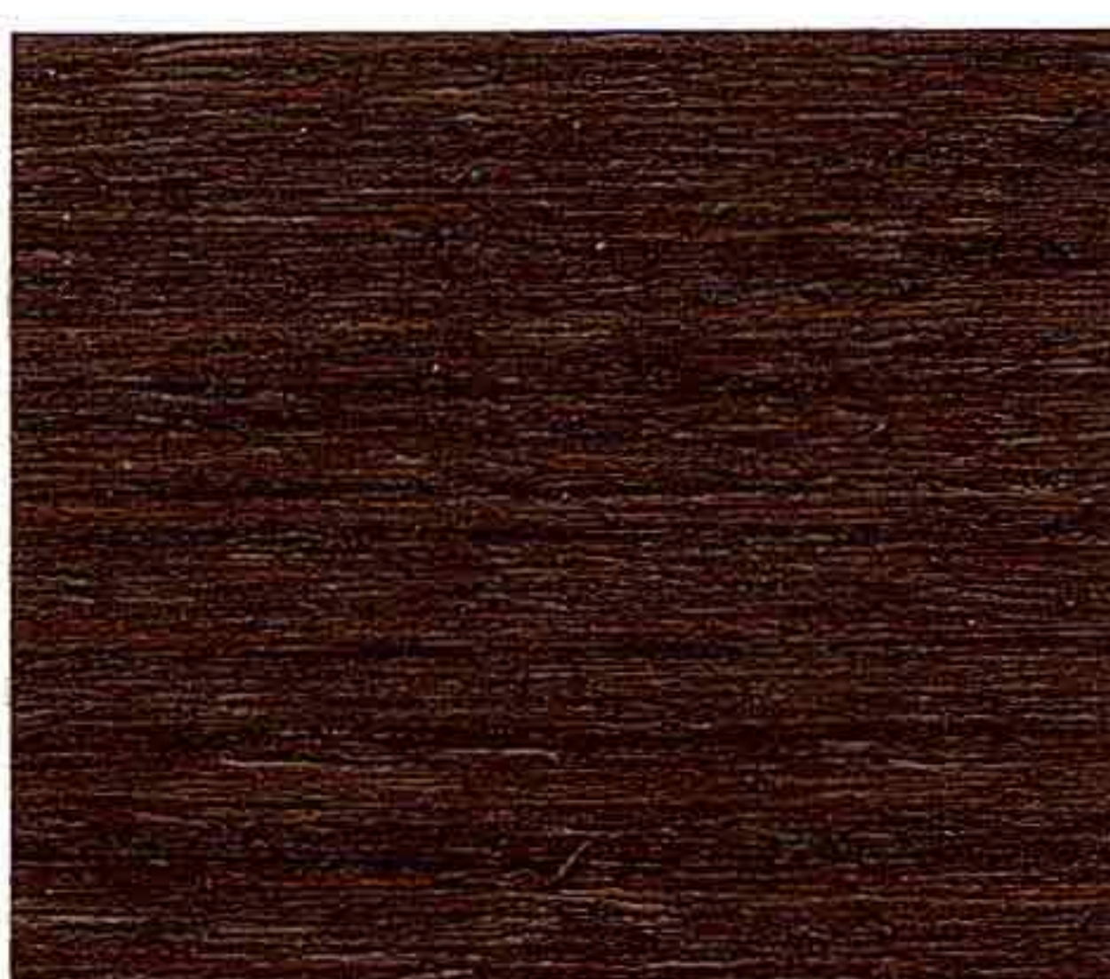
NOCE CHIARO 2° MANO

Il risultato estetico finale, specie per i colori più chiari, può subire variazioni anche notevoli in funzione di: