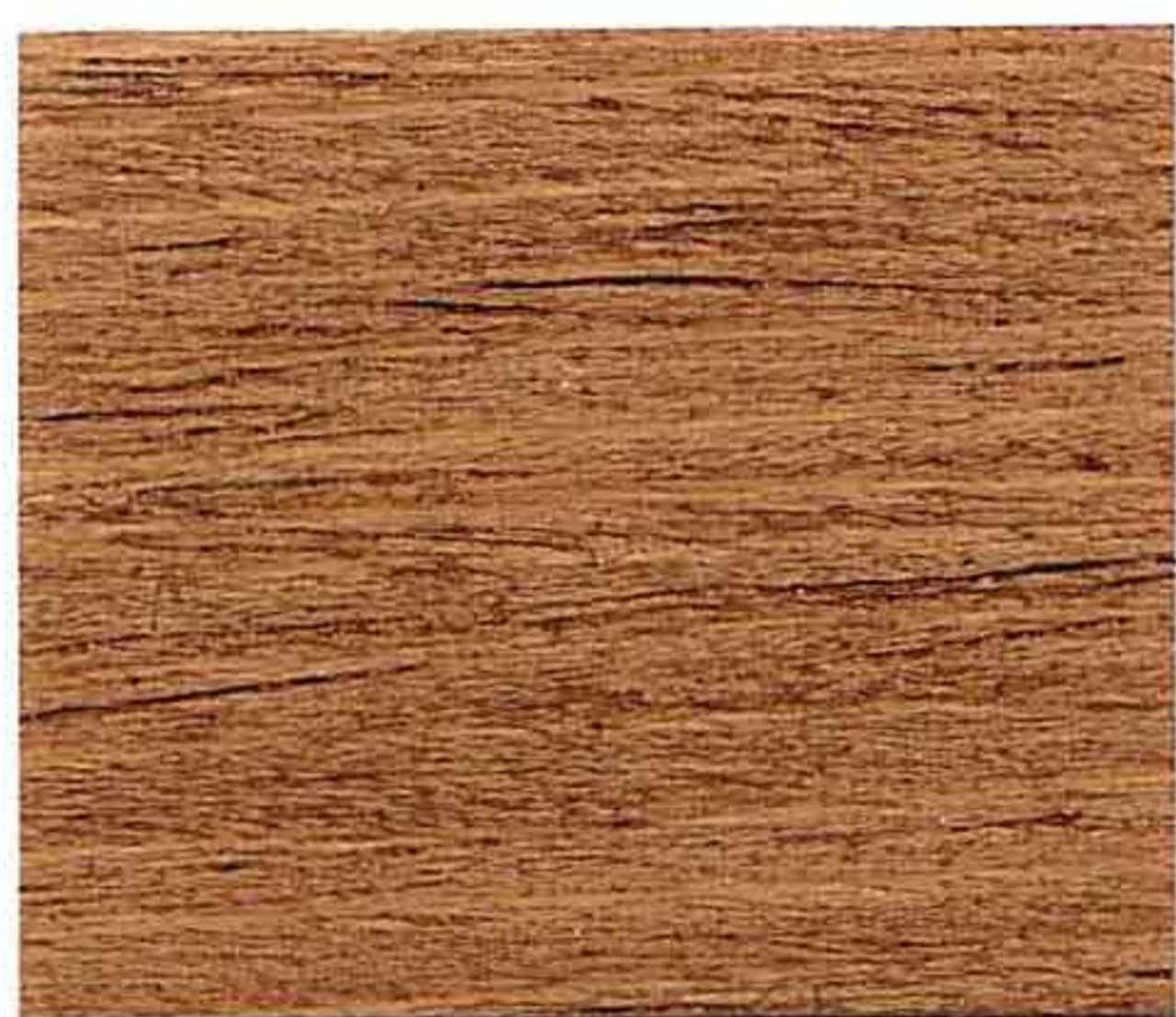
NOCE CHIARO 1° MANO