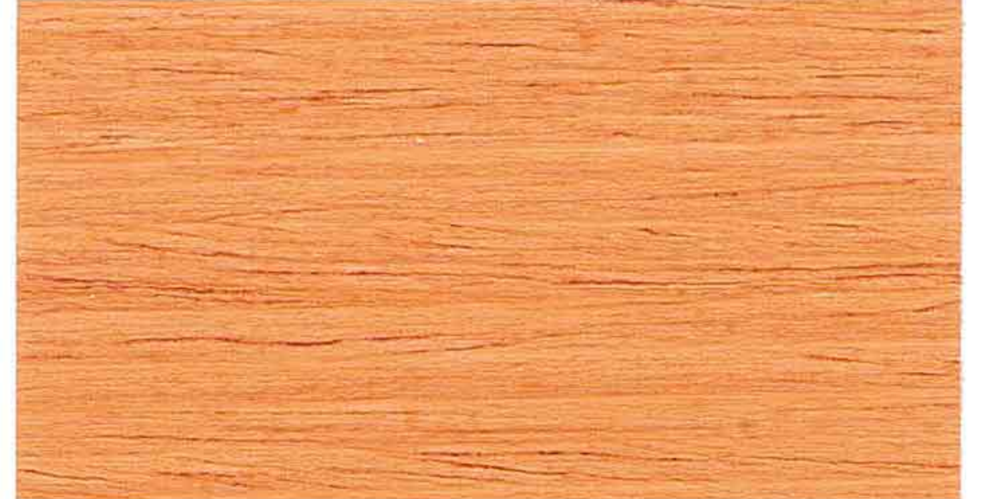
DOUGLAS 2° MANO