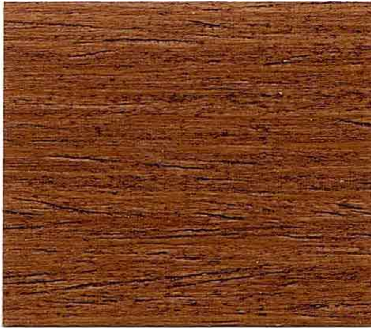
NOCE CHIARO 2° MANO