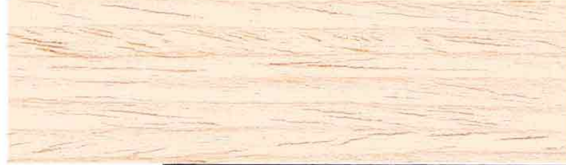
LEGNO NATURALE CHIARO