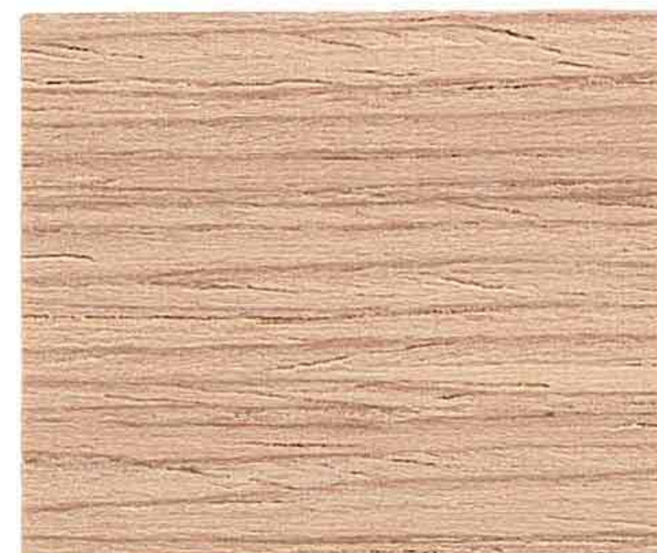
LEGNO NATURALE MEDIO