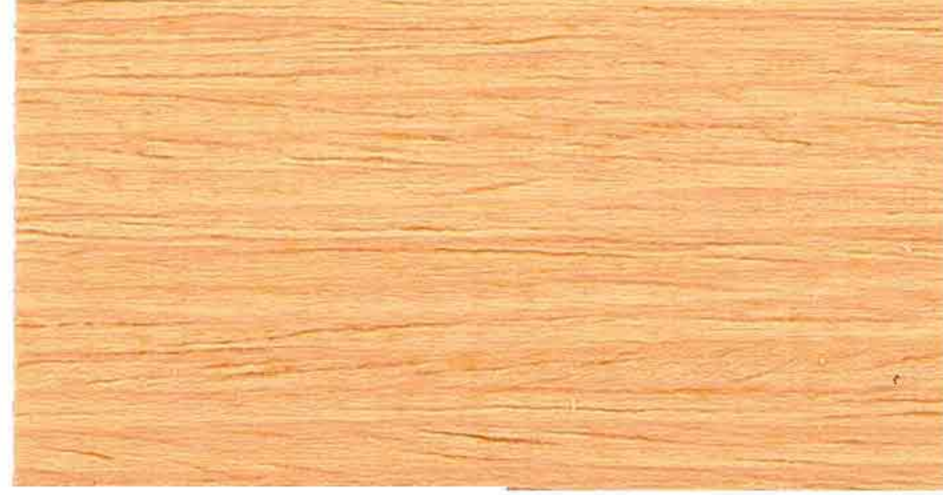
PINO 2° MANO