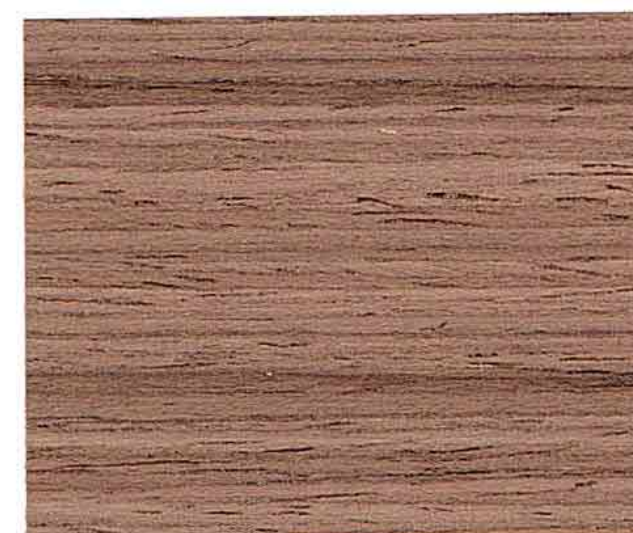
LEGNO NATURALE SCURO