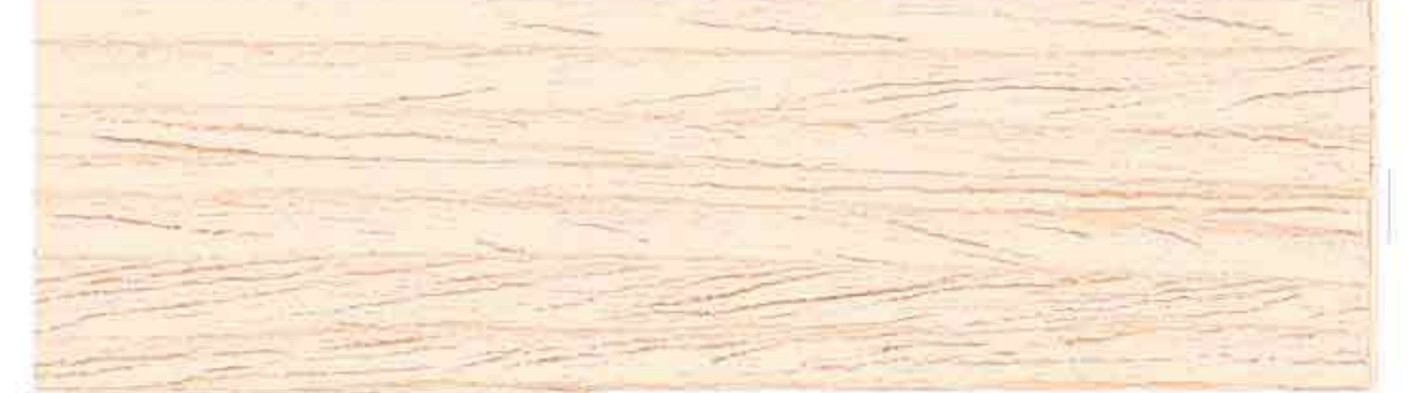
EGNO NATURALE CHIARO